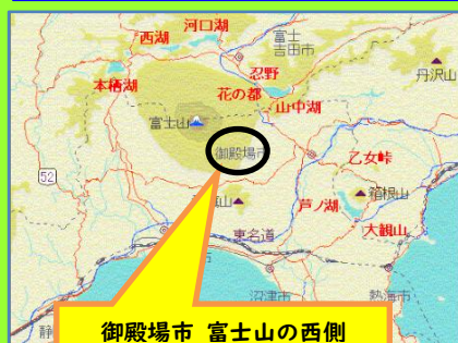
御殿場市 富士山の西側