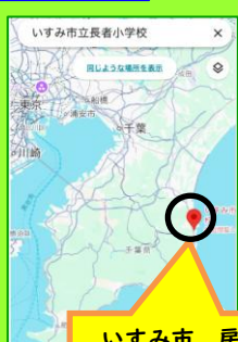
いすみ市 房総半島の東海岸